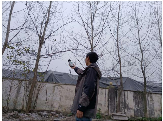
厂界 2# (▲2) 噪声