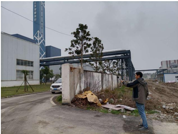
厂界 3# (▲3) 噪声