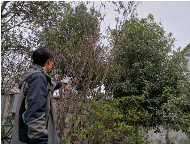
厂界 1# (▲1) 噪声